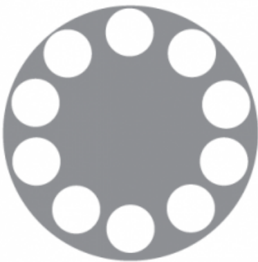
48" - 10 discs per head