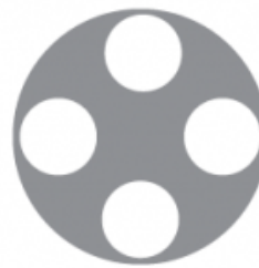
16 - 20" - 4 discs