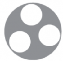
14 - 15" - 3 discs